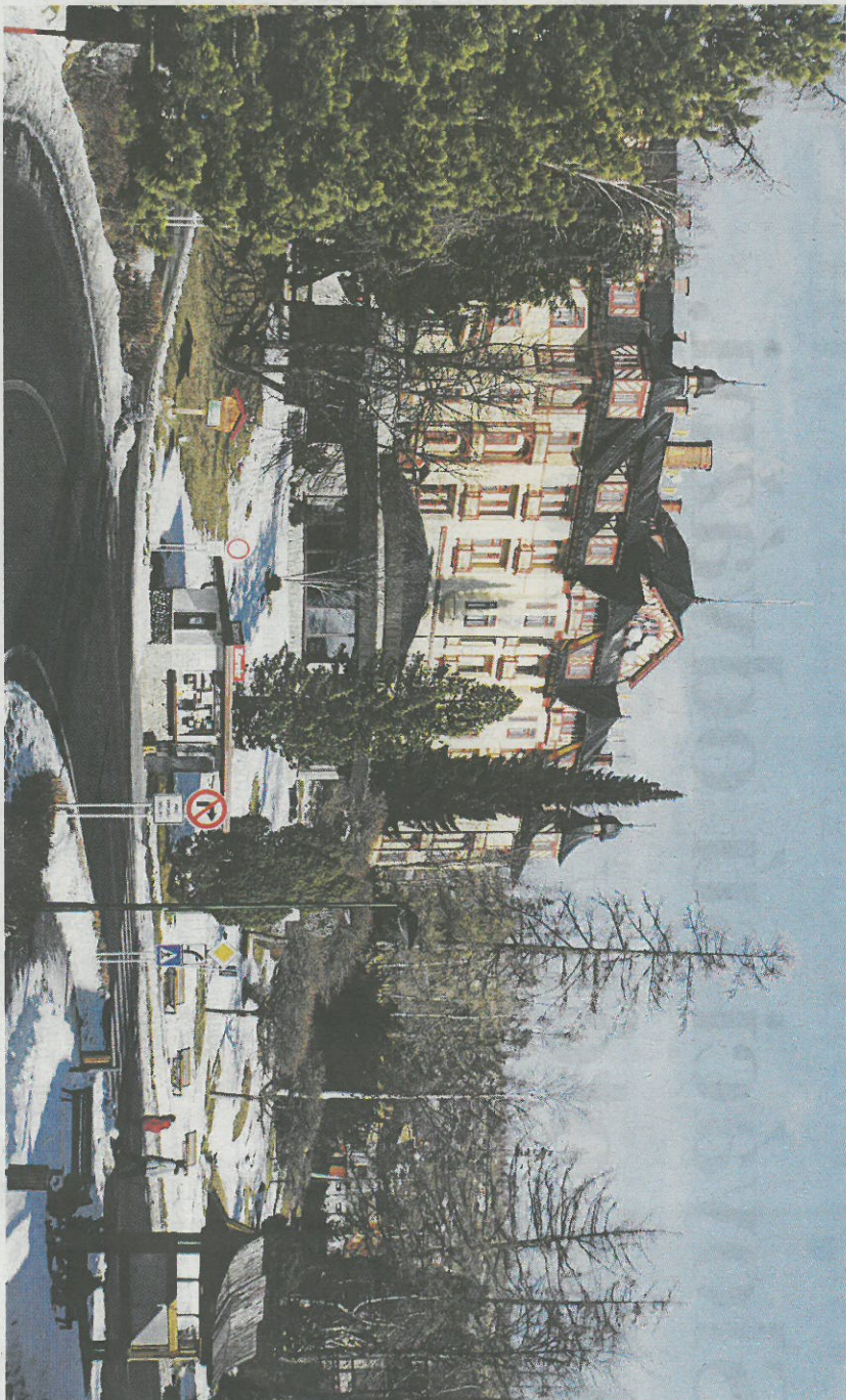
Populárna kyselka zo Starého Smokovca má ambíciu dostať sa na pulty obchodov a stoly reštaurácií.